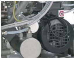
Vacuum pump Pompa del vuoto