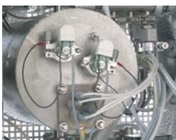
Separated steam generator Generatore di vapore esterno