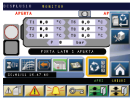
DCS PLUS 10 process controller Controllore di processo DCS PLUS 10