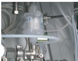
Air sterilization filter Filtro per l'aria